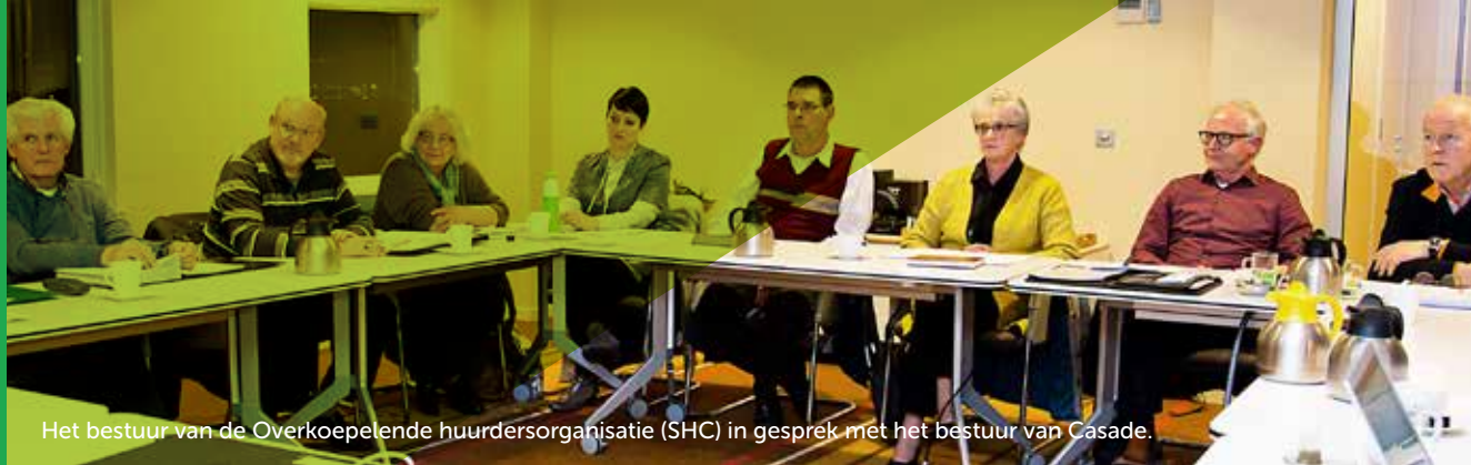
Het bestuur van de Overkoepelende huurdersorganisatie (SHC) in gesprek met het bestuur van Casade.

Als uw huis aan de beurt is, krijgt u uiteraard persoonlijk bericht van ons.